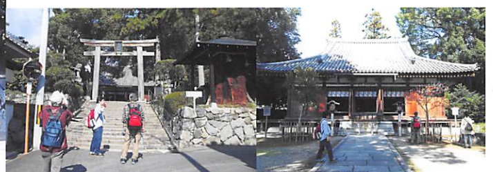
若宮社 元大御輪寺 祭神 大直禰子命