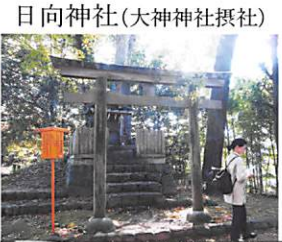
日向神社(大神神社摂社)