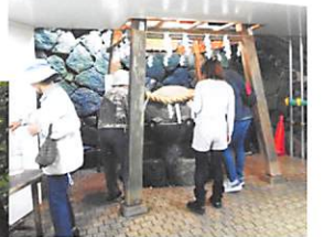
狭井神社は檜屋根の 葺き替えの為テントの中 『葉井戸』の水を飲めば 病気が治るといわれる