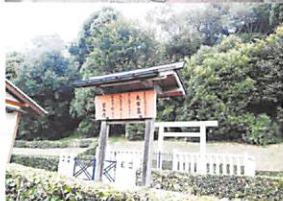
大市墓(宮内庁) 箸墓古墳

香具山は 畝傍ををしと 耳成と相争ひき 神代よりかくに あるらし古も 然にあれこそ うつせみも 妻を争ふらしき 天智天皇 卷1-13