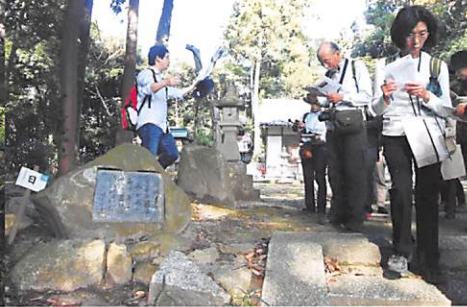
崇神天皇磯城瑞籬宮跡、志貴御県坐神社