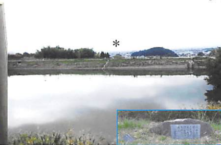
曇天の為 *二上山は見えにくい