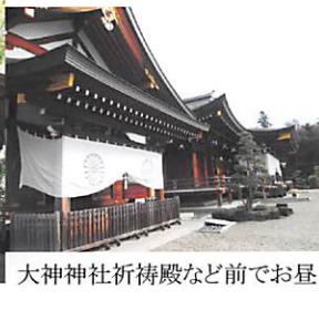
大神神社祈禱殿など前でお昼