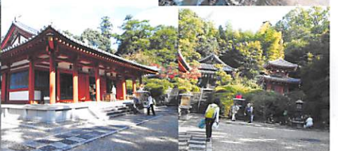
聖徳太子創建 珍しい二重塔(釈迦堂)