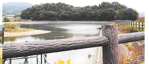
20数基の歌碑他を訪ねました。 巻向駅に到着