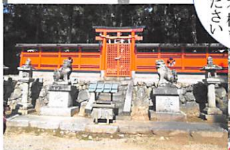
八阪神社(大神神社末社)