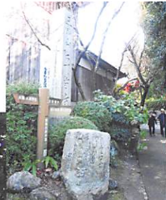
三輪山平等寺 元大神神社の神宮寺