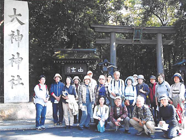
日向社を拜して大神神社へ到着