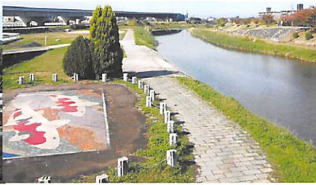
大向寺橋より 大和川(初瀬川)川下と川上