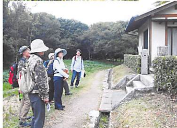
箸墓古墳 倭迹迹日百襲姫 3世紀中 278m

日本書紀 日は人が作り 夜は神が作った 大阪に 継ぎ登れる 石群れを 手通伝に越さば 越しかてむかも