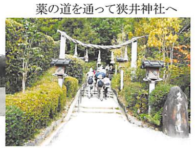
葉の道を通って狭井神社へ