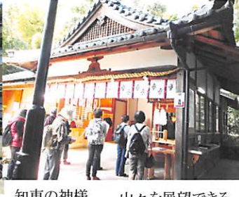
知恵の神様 山々を展望できる