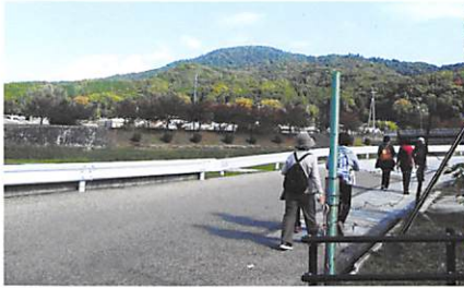
桜井駅から歩くこと20分 三輪山

—大神神社—若宮社—久延彦神社…昼食(三輪駅から帰宅可)—狭井神社—玄賓庵—檜原神社—箸墓古墳—巻向駅