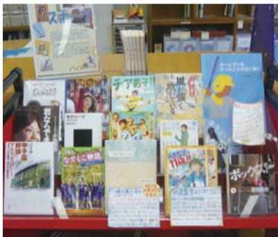
展示場所/3階カウンター前

クラブやサークル活動はもちろん、オリンピックやW杯の観戦で胸を熱くすることも多いのではないのでしょうか? しかし、本のなかにもたくさんの「スポーツ」があります。小説、ノンフィクション、エッセイ... 身近なスポーツでもまだまだ知らないことばかり。きっと新たな感動を呼び起こしてくれますよ!