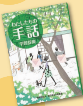
『わたしたちの手話学習辞典』 大杉豊, 関宜正編集 【請求記号: 378.28 || O79(辞書・事典)】