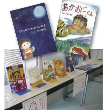
展示場所/4階(南)漫画書架付近

絵本作りを学んだ卒業生の作品を展示しています。未来書店とのコラボで出版が実現した絵本も加わってとっても華やか。才能ある先輩たちの卒業後の大活躍に心が躍り、夢がふくらみますね。ぜひ手に取ってみてください。