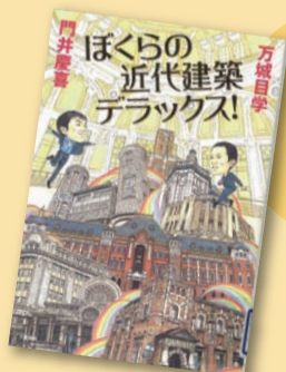
『ぼくらの近代建築デラックス!』 万城目学, 門井慶喜著 【請求記号: 523.1 || MA34】