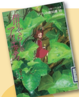
『借りぐらしのアリエッティ (ジブリの教科書.16)』 スタジオジブリ, 文春文庫編 【請求記号: 778.7 || SU83】

2014年度前期、新たに図書館に仲間入りした本です。小説から専門書まで充実のラインナップ! ぜひ手に取ってみてください。