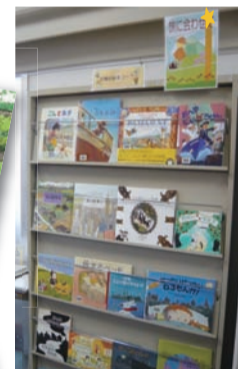
展示場所/4階(南)漫画書架付近