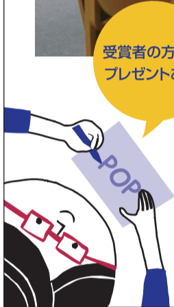
展示場所/3階カウンター前