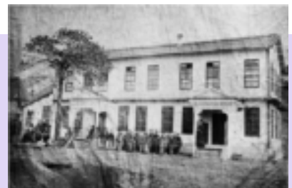
創設期(1879)の土佐堀校舎

今回、学園資料室所蔵品を中心に公開展示しております。ゆっくりと学園の歴史の一端に触れてみてください。