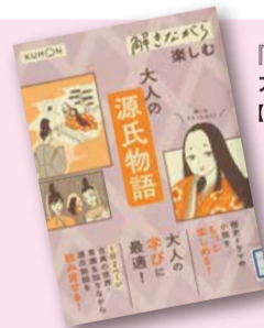
『解きながら楽しむ大人の源氏物語：大人の学びに最適!』 【請求記号：913.36 || T032】