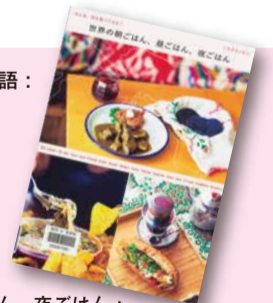
『世界の朝ごはん、昼ごはん、夜ごはん：みんな、何を食べてるの?』 ニキスキッチン著 【請求記号：596 || N73】