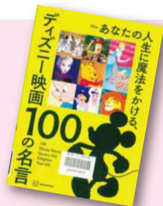
『あなたの人生に魔法をかける、ディズニー映画100の名言』 講談社編集 【請求記号：778.7 || K019】