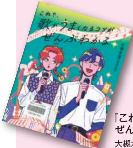
『これで、歌がうまくなるコツがぜんぶわかる』 大槻水澄著 【請求記号：767.1 || O89】