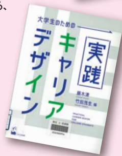
『大学生のための実践キャリアデザイン』 藤木清、竹田茂生編 【請求記号：就職 377.9 || F59】