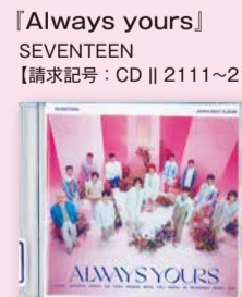
『Always yours』 SEVENTEEN 【請求記号：CD || 2111~2112】