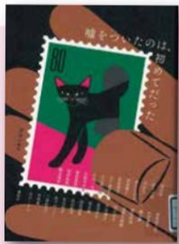
『嘘をついたのは、初めてだった』 講談社編 【請求記号：913.68 || K019】