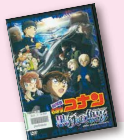
『黒鉄の魚影(サブマリン)』 青山剛昌原作：立川譲監督：櫻井武晴脚本 【請求記号：DVDビデオ || 778.7/ME】