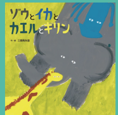
第6回 受賞作品 『ソウとイカと カエルとキリン』 作・絵 三岡 有矢音