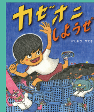
第7回 受賞作品 『カゼオニしろうぜ』 作・絵 にしおか ひでき