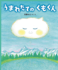
第12回 受賞作品 『うまれたてのくもくん』 作・絵 天野 みえ