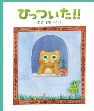
第10回 受賞作品 『ひっついた!!』 作・絵 さとむら まき