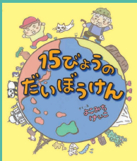
第13回 受賞作品 『15びょうの たいぼうけん』 作・絵 よこみち けいこ