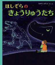
第9回 受賞作品 『ほしぞらの きょうりゅうたち』 作・絵 なかた みちよ